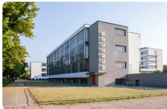
Das Bauhausgebäude, Gropiusallee 38

10,00 € (Studenten/Rentner/Auszubildende)