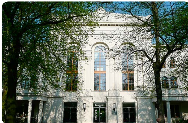
Das IGZ-Inno-Live im Kurpark Salzellen

10,00 € (Studenten/Rentner/Auszubildende)